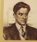
В. В. Маяковский