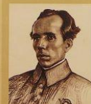
Н. А. Островский