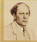
А. Н. Толстой