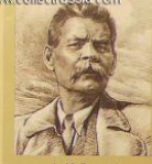
А. М. Горький