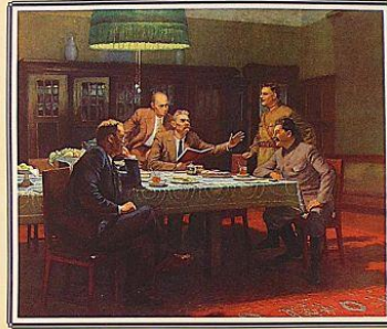
М. Горький читает гг. Стаханову, Молотову и Ворошилову свою сказку «Будущая и смерть» Рисунки: М. Горький (1926 г.)