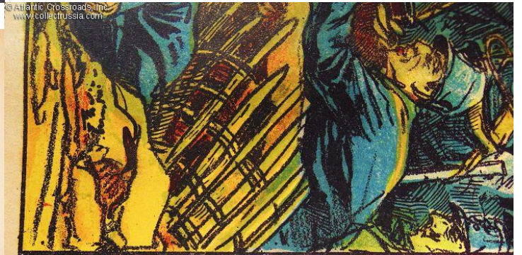
Т-во Типо-Литографий И. М. Машистова, Москва.