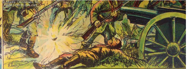
В 12 часов дня, после семидневного боя наша армия овладела передовыми сильно укрепленными позициями Львова, вынесенными на 15—20 верст к востоку от города, и приблизилась к главным львовским фортам. После крайне упорного боя 19 августа австрийцы бьжжали в беспорядке, бросив легкия и тяжелые орудия, артиллерийские парки и походный лагерь. Наши авангарды и конница пресл...