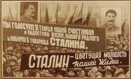
Митинг в Сталинском избирательном округе, поздравительный митинг в Верховном Совете СССР, декабрь 1937 года.