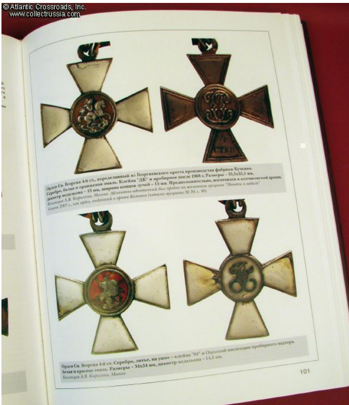
Орден Св. Георгия 4-й ст., переданный из Георгиевского креста провинциала фабрика Кучина. Серебро, белая и оранжевая эмаль. Клейма "ДК" и пробирное письмо 1908 г. Размеры - 35,5x35,5 мм, диаметр медальона - 15 мм, ширина концов крестов - 13 мм. Предоставлено, изготовлен в киевской армии. Коллекция А.В. Коршуна, Москва. Обложка иллюстрирована для продажи на аукционе "Монеты и металлы" в июне 2007 г., аукцион, аукцион и аукцион (таблица аукциона № 20, с. 96)