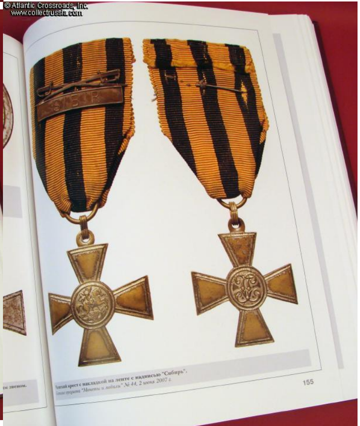
Частный крест с накладкой на ленте с надписью "Сибирь", ленте отряда "Монеты и металлы" № 44, 2 июня 2007 г.