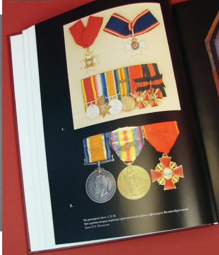
На развороте (илл. 1, 2, 3). Три группы наград периода гражданской войны офицеров Великобритании. Адам Н.А. Пельман