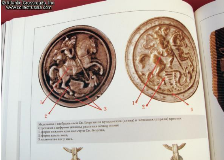
Медальоны с изображением Св. Георгия на кавказских (слева) и чешских (справа) крестах. Стрелками с цифрами указаны различия между ними: 1. форма нижнего края кольчуги Св. Георгия, 2. форма крыла змея, 3. количество ног у змея.