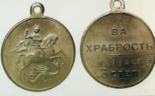
Кавказская медаль с изображением Св. Георгия, изготовленная в 1917 г. на Монетном дворе императора Всероссийских императора.

И наконец, последнюю группу "К" составляют медали с изображением Георгиевского креста на вершине.