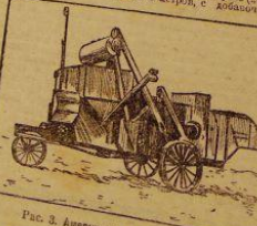
Рис. 3. Американский комбайн «Хенри».

от 7 до 40 га за 10 часов работы. Скорость передвижения трактора равна от 3 до 4 км/ч, а комбайна — от 2 до 3 км/ч. В 1920-е годы комбайны с захватом шириной от 2 до 3 метров работали с захватом шириной от 1 до 2 метров. В настоящее время комбайны с захватом шириной от 4 до 6 метров работают с захватом шириной от 2 до 3 метров.