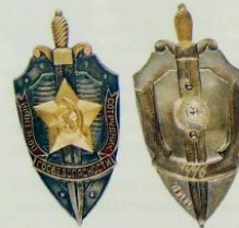
2.16. Знак Почетный сотрудник госбезопасности (1957-1991). Вариант 6 Номер: 7446 Мастерская: ММД Металл: томпак, оксидирование Цена: 60 000 P