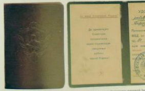
Хромирование к знаку «Отличный пограничник» МВД 1953–1957 гг. Награжден районный З...