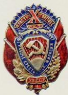
Тип 1 (узкий)

СССР. В них за основу взят стиль производства Стильмета, но вме- стительности «РСФСР» на ленте сделана табличка с названием Узбекск ки — «УзССР».