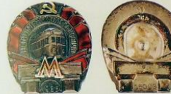
2.353. Наградной знак «Почётный знак Моссовета за ударную работу на строительстве метрополитена им. Л. М. Кагановича 1935» Номер: 15003 Мастерская: ЛМД Металл: серебро Цена: 30 000 P