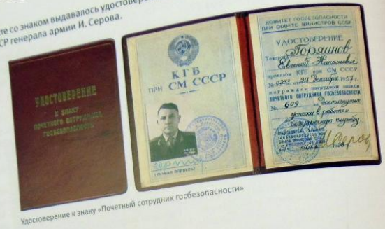
Удостоверение к знаку «Почетный сотрудник госбезопасности»

Вместе со знаком выдавалось удостоверение КГБ при Советском правительстве КГБ СССР генерала армии И. Серова.