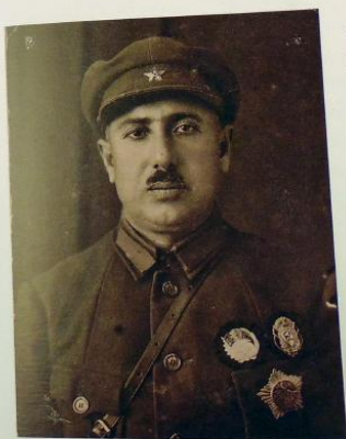
Юнус Махмудов. Начальник Главного управления милиции Бухарской республики

Юбилейный бронзовый знак в 10-летия РКМ (1917-1927). Узбе Мастерская: Стильмет, Москва Металл: серебро