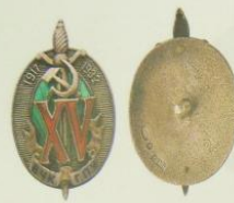
2.13. Наградной юбилейный знак «Почетный работник ВЧК-ГПУ 1917–1932». Тип 2.2 Номер: 12 Мастерская: НКПС Металл: серебро Цена: 2 000 000 Р