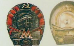
2.355. Наградной знак «Почётный знак Моссовета за ударную работу на строительстве Метрополитена им. Л. М. Кагановича 1938, II очередь» Номер: 24508 Мастерская: ЛМД Металл: серебро Цена: 30 000 P