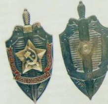
2.15. Знак Почетный сотрудник госбезопасности (1957-1991). Вариант 1 Номер: 170 Мастерская: ММД Металл: томпак, оксидирование Цена: 100 000 P