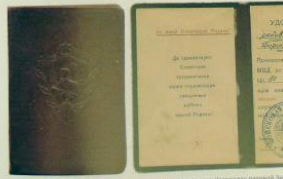
Удостоверение к знаку «Отличный пограничник» МВД 1957-1957 гг. Наказан районный...