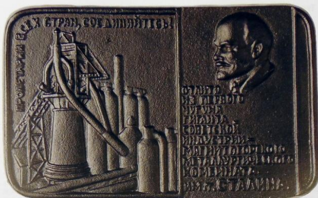
Памятная наградная доска, отлитая из чугуна первой плавки Домны № 1 1-го февраля 1932 года.

В предлагаемой вашему вниманию коллекции имеется уникальный артефакт — памятная наградная доска, отлитая из чугуна первой плавки Домны № 1 1-го февраля 1932 года. Этой доской была награждена госпожа Шютте-Лихоцки.