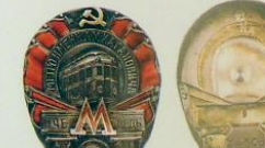
2.355. Наградной знак «Почётный знак Моссовета за ударную работу на строительстве метрополитена им. Л. М. Кагановича 1938, II очередь» Номер: 24508 Мастерская: ЛМД Металл: серебро Цена: 30 000 P