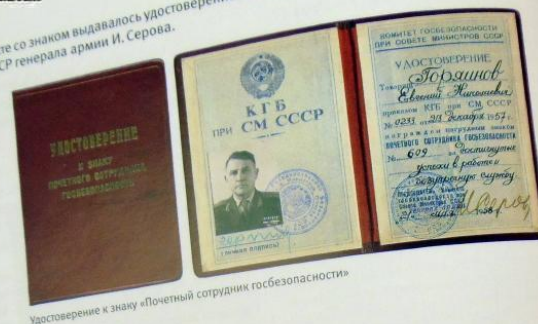
Удостоверение к знаку «Почетный сотрудник госбезопасности»

Вместе со знаком выдавалось удостоверение КГБ при Советском правительстве КГБ СССР генерала армии И. Серова.