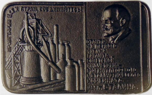
Памятная наградная доска, отлитая из чугуна первой плавки Домны № 1 1-го февраля 1932 года.

В предлагаемой вашему вниманию коллекции имеется уникальный артефакт — памятная наградная доска, отлитая из чугуна первой плавки Домны № 1 1-го февраля 1932 года. Этой доской была награждена госпожа Шютте-Лихоцки.