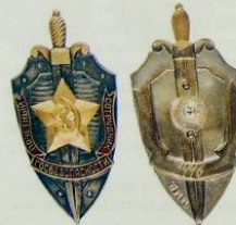
2.16. Знак Почетный сотрудник госбезопасности (1957–1991). Вариант 6 Номер: 7446 Мастерская: ММД Металл: томпок, оксидирование Цена: 60 000 Р