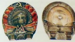
2.352. Наградной знак «Почётный знак Моссовета за ударную работу на строительстве Метрополитена им. Л. М. Кагановича 1935» Номер: 717 Мастерская: «Всекохудожник», Москва Металл: серебро Цена: 70 000 P