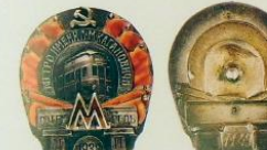
2.354. Наградной знак «Почётный знак Моссовета за ударную работу на строительстве метрополитена им. Л. М. Кагановича 1938, II очередь» Номер: 1149 Мастерская: «Всекохудожник», Москва Металл: серебро Цена: 120 000 P