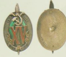
2.13. Наградной юбилейный знак «Почетный работник ВЧК-ГПУ 1917-1932». Тип 2.2 Номер: 12 Мастерская: НКПС Металл: серебро Цена: 2 000 000 P