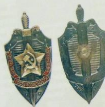
2.15. Знак Почетный сотрудник госбезопасности (1957–1991). Вариант 1 Номер: 170 Мастерская: ММД Металл: томпок, оксидирование Цена: 100 000 Р