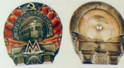
2.352. Наградной знак «Почётный знак Моссовета за ударную работу на строительстве метрополитена им. Л. М. Кагановича 1935» Номер: 717 Мастерская: «Всекохудожник», Москва Металл: серебро Цена: 70 000 P