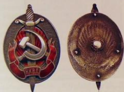
2.14. Знак «Заслуженный работник НКВД» (1941–1946), ММД Номер: 504 Металл: томпок Награжден: Лучинин В.Д. Цена: 300 000 Р

В данном разделе для полноты отражения ведомственных наград ВЧК-КГБ мы представляем знак Заслуженный работник НКВД, врученный именно сотруднику госбезопасности.