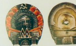
2.354. Наградной знак «Почётный знак Моссовета за ударную работу на строительстве Метрополитена им. Л. М. Кагановича 1938, II очередь» Номер: 1149 Мастерская: «Всекохудожник», Москва Металл: серебро Цена: 120 000 P