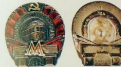
2.353. Наградной знак «Почётный знак Моссовета за ударную работу на строительстве Метрополитена им. Л. М. Кагановича 1935» Номер: 15003 Мастерская: ЛМД Металл: серебро Цена: 30 000 P