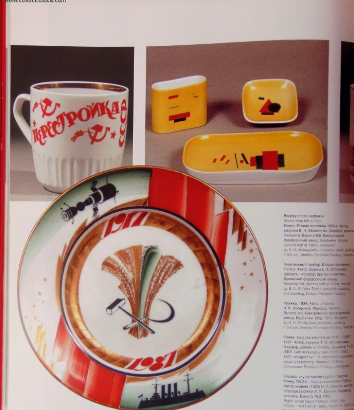
Вверху: тарелка Трубач, 1922. Автор росписи и росписи М. В. Писахова. Фарфор, роспись, полировка, диаметр 25,2 см. Below: Iron Embroidering Basket, 1922, model by M. V. Pishakova, porcelain, painting, h 14.7 cm, State Porcelain Factory, Petrograd