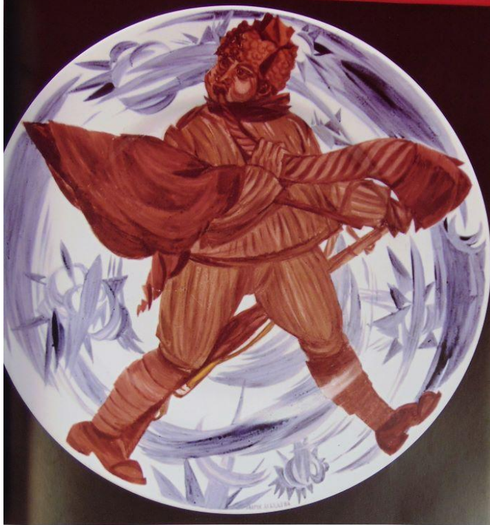
Слева: тарелка с изображением марши Советов марши комсомола по кубанской компании М. Пана, 1920-е годы, роспись, диаметр 25,2 см. Plate with image of March of Soviet Commissars after Cubes company by M. Pana, 1920s, faience, painting, diameter 25.2