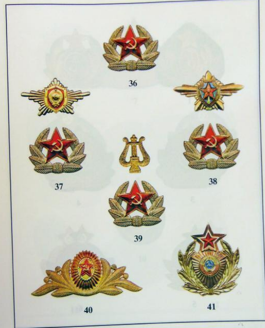
36. Старшины, сержанты, солдаты, курсанты, 1969. 37-38. Сержантский и рядовой состав роты Почетного караула, 1969. 39. Сержантский и рядовой состав сводного Военного оркестра, 1969. 40. Marshals родов войск и генералы (повседневная форма), 1988. 41. Офицеры, прапорщики, военнослужащие сверхсрочной службы (проектный образец), 1990.