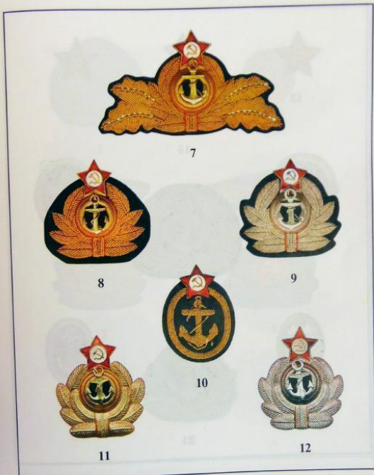
7. Адмиралы (кроме Адмиралов флота Советского Союза), 1943. 8. Офицеры и мичманы, адмиралы и генералы ВМФ (повседневная форма), 1958. 9. Инженерно-командный состав (адмиралы - на повседневной форме), 1958. 10. Главные старшины, старшие сержанты, 1940. 11-12. Офицерский состав корабельной и инженерно-корабельной служб, 1964.