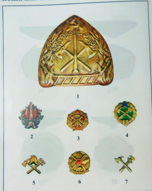
1. Личный состав пожарных команд и организаций (на касках), 1925. 2. Высший начальствующий состав, 1923. 3-4. Пожарно-сторожевая охрана Наркомата тяжелой промышленности, 1934. 5. Рядовой и младший начсостав, 1927. 6. Члены пожарных бригад Осоавиахима УССР, 1930. 7. Работники городской пожарной охраны и госпожнадзора, 1932.