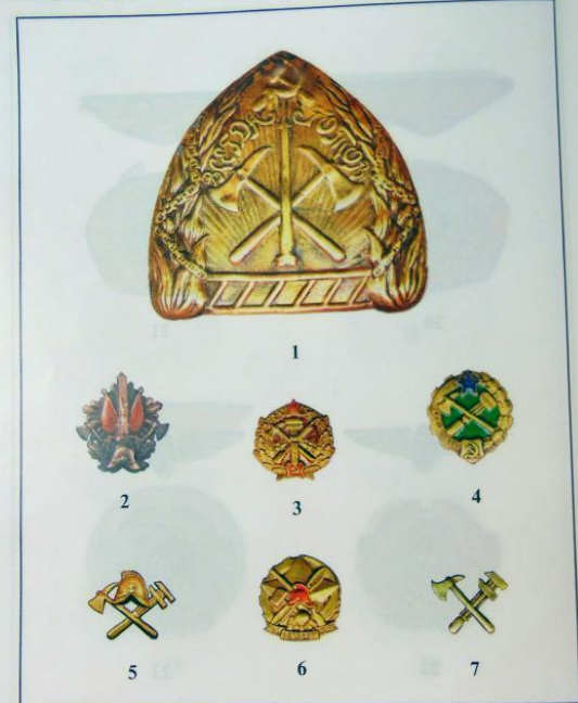
1. Личный состав пожарных команд и организаций (на касках), 1925. 2. Высший начальствующий состав, 1923. 3-4. Пожарно-сторожевая охрана Наркомата тяжелой промышленности, 1934. 5. Рядовой и младший начсостав, 1927. 6. Члены пожарных бригад Осоавиахима УССР, 1930. 7. Работники городской пожарной охраны и господанадзора, 1932.