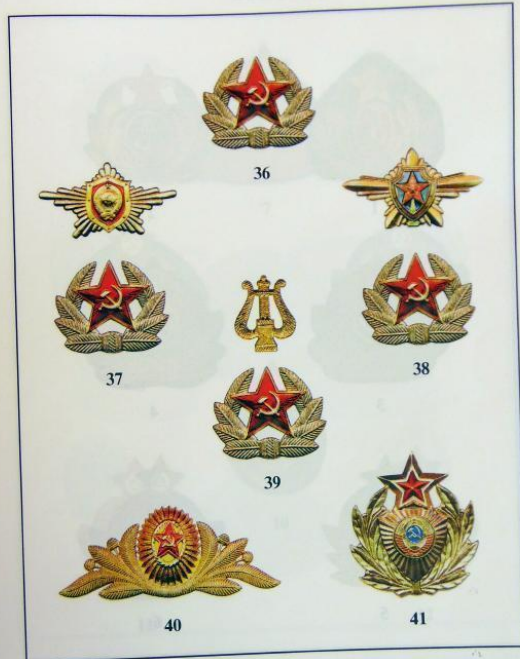
36. Старшины, сержанты, солдаты, курсанты, 1969. 37-38. Сержантский и рядовой состав роты Почетного караула, 1969. 39. Сержантский и рядовой состав сводного Военного оркестра, 1969. 40. Маршалы родов войск и генералы (повседневная форма), 1988. 41. Офицеры, прапорщики, военнослужащие сверхсрочной службы (проектный образец), 1990.