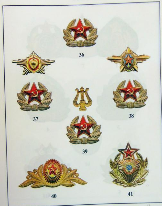
36. Старшины, сержанты, солдаты, курсанты, 1969. 37-38. Сержантский и рядовой состав роты Почетного караула, 1969. 39. Сержантский и рядовой состав сводного Военного оркестра, 1969. 40. Маршалы родов войск и генералы (повседневная форма), 1988. 41. Офицеры, прапорщики, военнослужащие сверхсрочной службы (проектный образец), 1990.