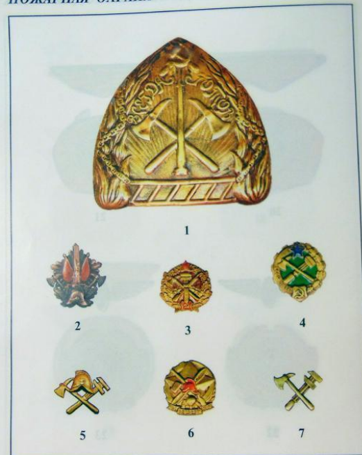
1. Личный состав пожарных команд и организаций (на касках), 1925. 2. Высший начальствующий состав, 1923. 3-4. Пожарно-сторожевая охрана Наркомата тяжелой промышленности, 1934. 5. Рядовой и младший начсостав, 1927. 6. Члены пожарных бригад Осоавиахима УССР, 1930. 7. Работники городской пожарной охраны и госпожнадзора, 1932.