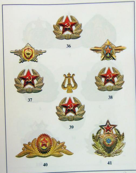
36. Старшины, сержанты, солдаты, курсанты, 1969. 37-38. Сержантский и рядовой состав роты Почетного караула, 1969. 39. Сержантский и рядовой состав сводного Военного оркестра, 1969. 40. Маршалы родов войск и генералы (повседневная форма), 1988. 41. Офицеры, прапорщики, военнослужащие сверхсрочной службы (проектный образец), 1990.