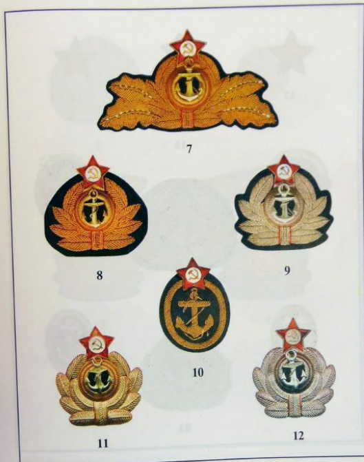
7. Адмиралы (кроме Адмиралов флота Советского Союза), 1943. 8. Офицеры и мичманы, адмиралы и генералы ВМФ (повседневная форма), 1958. 9. Инженерно-командный состав (адмиралы - на повседневной форме), 1958. 10. Главные старшины, старшие сержанты, 1940. 11-12. Офицерский состав корабельной и инженерно-корабельной служб, 1964.