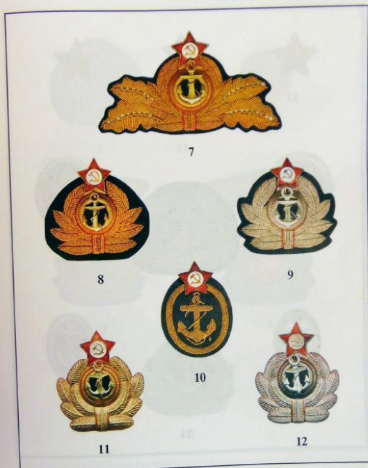
7. Адмиралы (кроме Адмиралов флота Советского Союза), 1943. 8. Офицеры и мичманы, адмиралы и генералы ВМФ (повседневная форма), 1958. 9. Инженерно-командный состав (адмиралы - на повседневной форме), 1958. 10. Главные старшины, старшие сержанты, 1940. 11-12. Офицерский состав корабельной и инженерно-корабельной служб, 1964.