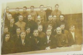
Группа колхозников-ударников Калининской области с членами правительства перед вручением наград, 1935 г.

В октябре 1933 года после уборки урожая около тысячи лучших ударниц-льноводок съехались в Москву на конференцию. Московские льнотеребильщицы обратились ко всем колхозникам и колхозницам-льноводам с призывом: «Советский лен должен быть лучшим в мире».