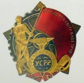
Орден Трудового Красного Знамени Украинской ССР

Все известные награждения данным типом знаков ограничиваются пределами Ленинградской области.