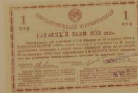
Облигация государственного краткосрочного сахарного займа на 1 руб. СВЗЗР. 1923 г.