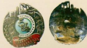
3-310. Наградной знак «Ударнику госкредита 5 в 4. Петроградск. РАЙКОМСОД», 1930 г. Мастерская: Г. Свенсон, Ленинград Металл: серебро