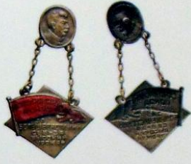
3-187. Памятный наградной жетон «Сталинский поход за Большевицкий сев и высокий урожай», 1933 г. Металл: железо, меднение, серебрение Цена: 20 000 Р