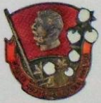
3-189. Памятный наградной знак «Сталинский поход за высокий урожай хлопка», УзССР, 1934 г. Мастерская: Фабмас (Фабрика массовых изделий Леноблсовеса), Ленинград Металл: железо, меднение, серебрение Цена: 15 000 Р