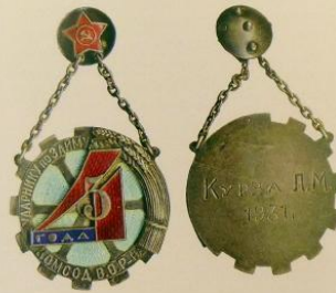
3-311. Наградной знак «Ударнику по займу 5 в 4. Комсод В.О.Р-на», 1931 г. Награжден: Л. М. Курза Мастерская: Г. Свенсон, Ленинград Металл: серебро