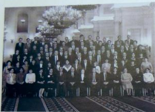
XVIII съезд профсоюзов СССР Москва, Кремль, февраль 1987 г.