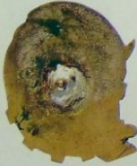
3-339. Наградной знак «За ударную работу по маслозаготовкам», 1932 г. Металл: томпак, серебрение Цена: 250 000 P