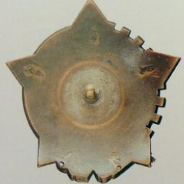
3-441. Наградной знак «Лучшему изобретателю. Борцу за науку и технику» Мастерская: ИЗО (?), Ленинград Металл: томпак Цена: 800 000 P