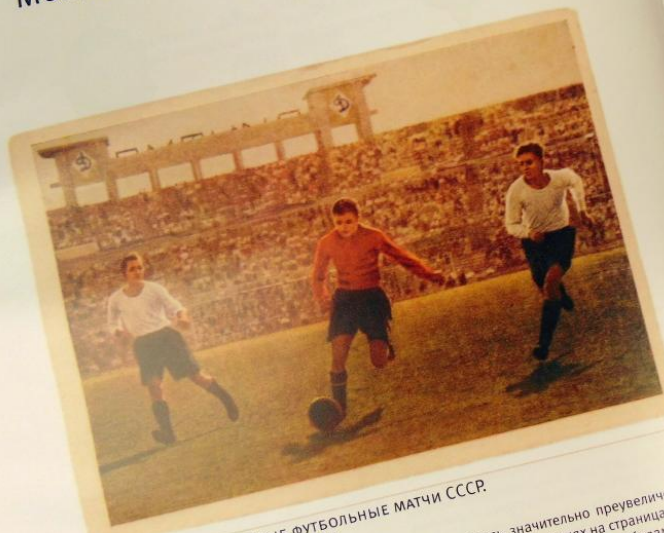
ПЕРВЫЕ МЕЖДУНАРОДНЫЕ ФУТБОЛЬНЫЕ МАТЧИ СССР. СССР — Турция, Турция — СССР

Все товарищеские матчи, сыгранные сбор- ной РСФСР в 1923 году, в мировой футбольной истории считаются неофициальными, так как не входили в календарь ФИФА и не входят в статистику международных матчей.