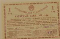
Облигация государственного краткосрочного сахарного займа на 1 пуд сахара. 1923 г

Массовые внутренние займы у населения являлись в Советском Союзе одним из основных источников пополнения государственного бюджета. Уже к концу 1922 г. был разработан проект внутреннего займа на 100 млн руб. золотом сроком на 10 лет.