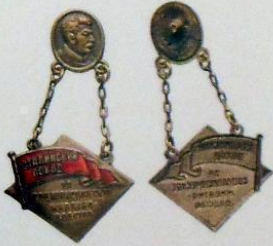
3-188. Памятный наградной жетон «Сталинский поход за Социалистическое животноводство», 1933 г. Металл: железо, меднение, серебрение Цена: 25 000 Р