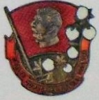
3-189. Памятный наградной знак «Сталинский поход за высокий урожай хлопка», УзССР, 1934 г. Мастерская: Фабмас (Фабрика массовых изделий Леноблсовеса), Ленинград Металл: железо, меднение, серебрение Цена: 15 000 Р