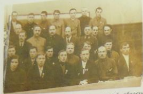
Группа колхозников-ударников Калининской области с членами правительства перед вручением наград, 1935 г.

В октябре 1933 года после уборки урожая около тысячи лучших ударниц-льноводок съехались в Москву на конференцию. Московские льнотеребильщицы обратились ко всем колхозникам и колхозницам-льноводкам с призывом: «Советский лен должен быть лучшим в мире».