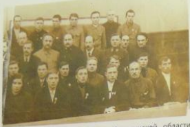
Группа колхозников-ударников Калининской области с членами правительства перед вручением наград, 1935 г.

В октябре 1933 года после уборки урожая около тысячи лучших ударниц-льноводок съехались в Москву на конференцию. Московские льнотеребильщицы обратились ко всем колхозникам и колхозницам-льноводкам с призывом: «Советский лен должен быть лучшим в мире».