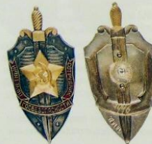
2.16. Знак Почетный сотрудник госбезопасности (1957- 1991). Вариант 6 Номер: 7446 Мастерская: ММД Металл: томпок, оксидирование Цена: 60 000 Р