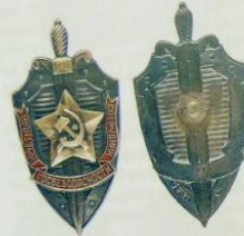
2.15. Знак Почетный сотрудник госбезопасности (1957–1991). Вариант 1 Номер: 170 Мастерская: ММД Металл: томпак, оксидирование Цена: 100 000 Р