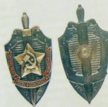
2.15. Знак Почетный сотрудник госбезопасности (1957- 1991). Вариант 1 Номер: 170 Мастерская: ММД Металл: томпок, оксидирование Цена: 100 000 Р