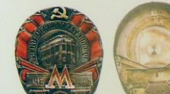
2.355. Наградной знак «Почётный знак Моссовета за ударную работу на строительстве метрополитена им. Л. М. Кагановича 1938, II очередь» Номер: 24508 Мастерская: ЛМД Металл: серебро Цена: 30 000 P