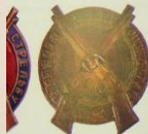
«за хорошую стрельбу» оставы войск ОГПУ, 1923 г.

были професными, знаки для войск ОГПУ были целыми и вся поверхность знака была покрыта эмалью цветов ведомства. Если знаки «за хорошую (отличную) стрельбу» для войск РККА не редки и попадаются на фалеристическом рынке достаточно регулярно, то знаки для ОГПУ являются раритетами и известны автору всего в 3-х экземплярах.