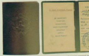
Удостоверение к знаку «Отличный пограничник» МВД 1957-1957 гг. Награжден районный...