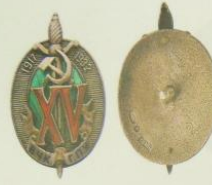
2.13. Наградной юбилейный знак «Почетный работник ВЧК-ГПУ 1917–1932». Тип 2.2 Номер: 12 Мастерская: НКПС Металл: серебро Цена: 2 000 000 Р