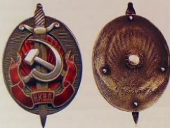
2.14. Знак «Заслуженный работник НКВД» (1941–1946), ММД Номер: 504 Металл: томпак Награжден: Лучинин В. Д. Цена: 300 000 Р

В данном разделе для полноты отражения ведомственных наград ВЧК-КГБ мы представляем знак Заслуженный работник НКВД, врученный именно сотруднику госбезопасности.