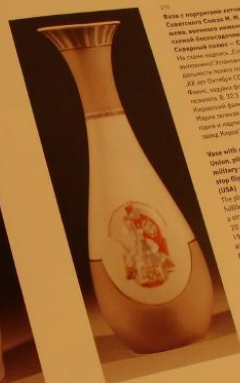
Vase with portraits of Khrushchev, Ustinov, pilots M.M. Gromov and military engineer S.A. Drabovskiy. Stop flight Moscow - New York (USA) The plan bears an ironic fulfillment: A few weeks after a straight line establishing 20 years of October 1937 Khrushchev's Secret

base with portraits of Heroes of the Soviet Union, pilots M.M. Gromov and A.S. Yumashev, military engineer S.A. Danilin and plan to stop flight Moscow - North Pole - San Francisco (USA). The plan breaks an international "barrier" and sets a new world record in flight time.