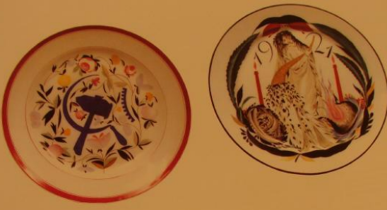
Тарелка «Синий герб» с эмблемой «серп и молот» на фоне полевых цветов. 1918 Чехосл. С. В. — автор рисунка Фарфор, наглазурная роспись. Дн 23,4 ГФЗ Марка ГФЗ подглазурная кобальтом с белой эмалью цифра «17» и серо-голубым

Designed by S.V. Chekhonin State Porcelain Factory, Petrograd Porcelain, overglaze painting SPF mark in cobalt underglaze dat '17 impressed into the paste, initia grayish-blue by the maker 4 3/4 x 6 cm