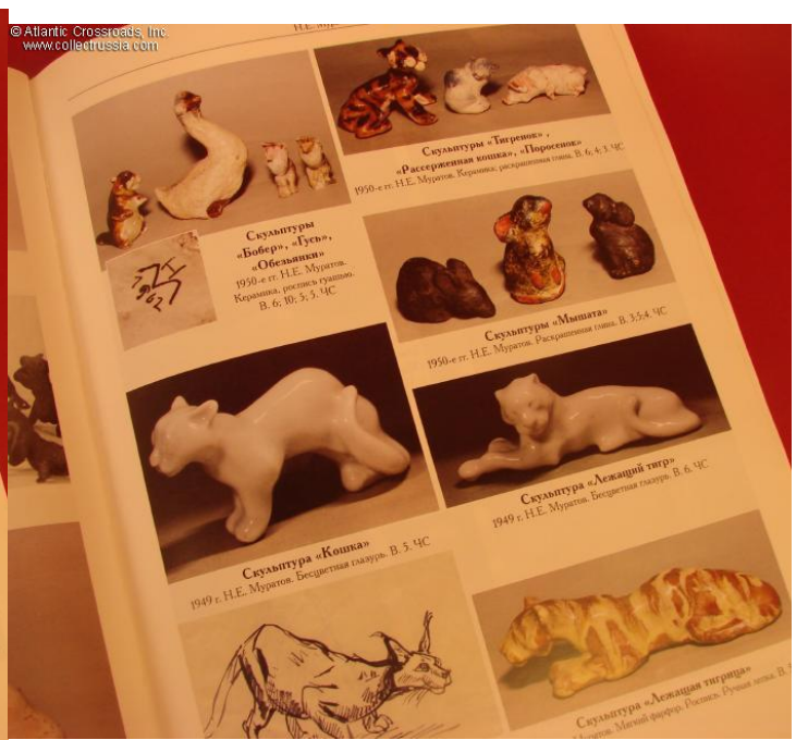
Скульптуры «Тигренок», «Рассерженная кошка», «Поросенок» М.М. Мелитов. Керемик, раскрашенная глаз. В. 6, 4, 3 см.