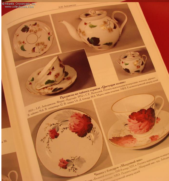
Чашка с блюдцем «Макровы» . ИФЗ конца XIX в. Роспись «Большой колокол». АФЗ. Подпись серая. «Макровский ман- дринский дворец-музей».