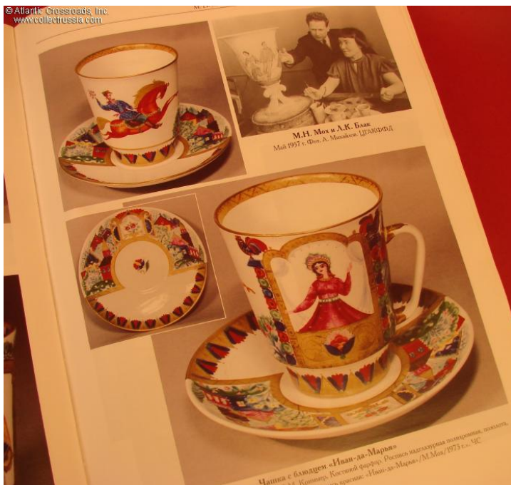
Чашка с блюдцем «Иван-да-Марья» Копилка. Костяной фарфор. Ростиславская мануфактура фарфора. Высота 10 см. Диаметр 10 см. Вес 100 г. М.М.М. 1973 г. ЧС