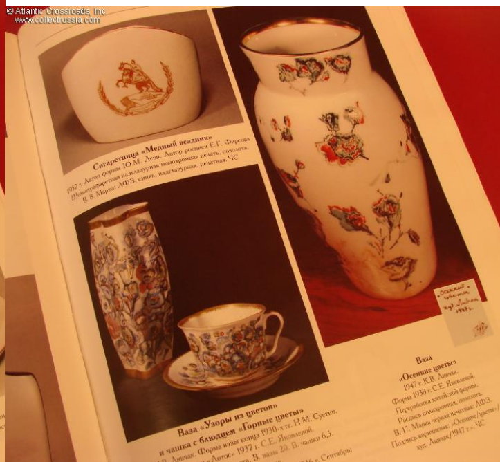
Ваза «Узоры» и чашка с блюдцем «Горные пики» Липецк. Форма вазы конца 1930-х гг. Н.М. «Дотос» 1937 г. С.Е. Яковлевой. В. вазы 20. В. чашки 6,5.