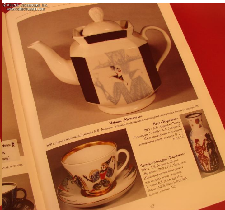
Чашка с блюдцем 1983 г. А.В. Даровин. Формы «Весенняя», 1949 г. С.Е. Яковлев Шелкографическая полихромная накладная печать, позолота. В. чашки 6,8. Д. блюдца 14,2. Марка: АФЗ. Made in RUSSIA красная, печатная. 4С