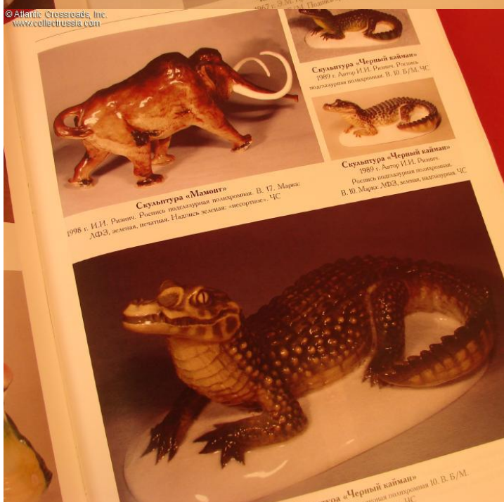
Скульптура «Черный квадрат» Автор И.И. Родченко. Россия В. 10. Б/М. ЧС.