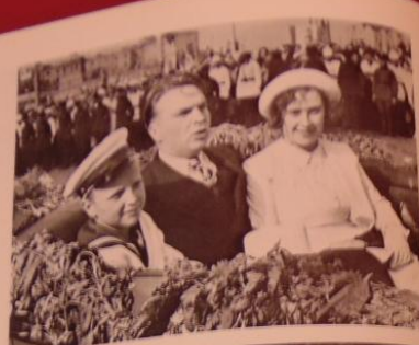
В Кремле на приеме высшего руководства