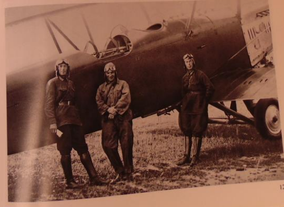
В. П. Чкалов с летчиками-испытателями НИИ ВВС. 1931 г.