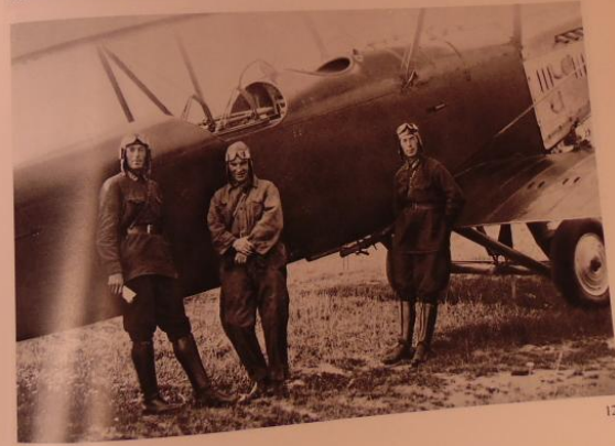
В. П. Чкалов с истребителем-бомбардировщиком ИС-1, 1931 г.