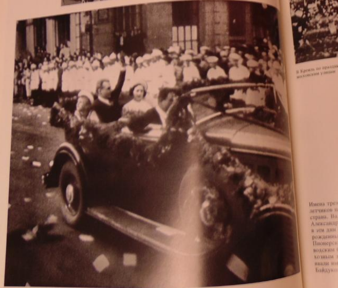
Имена трех детей не страна. Это Александр в эти дни рождения Павла во время открытия Байдуков