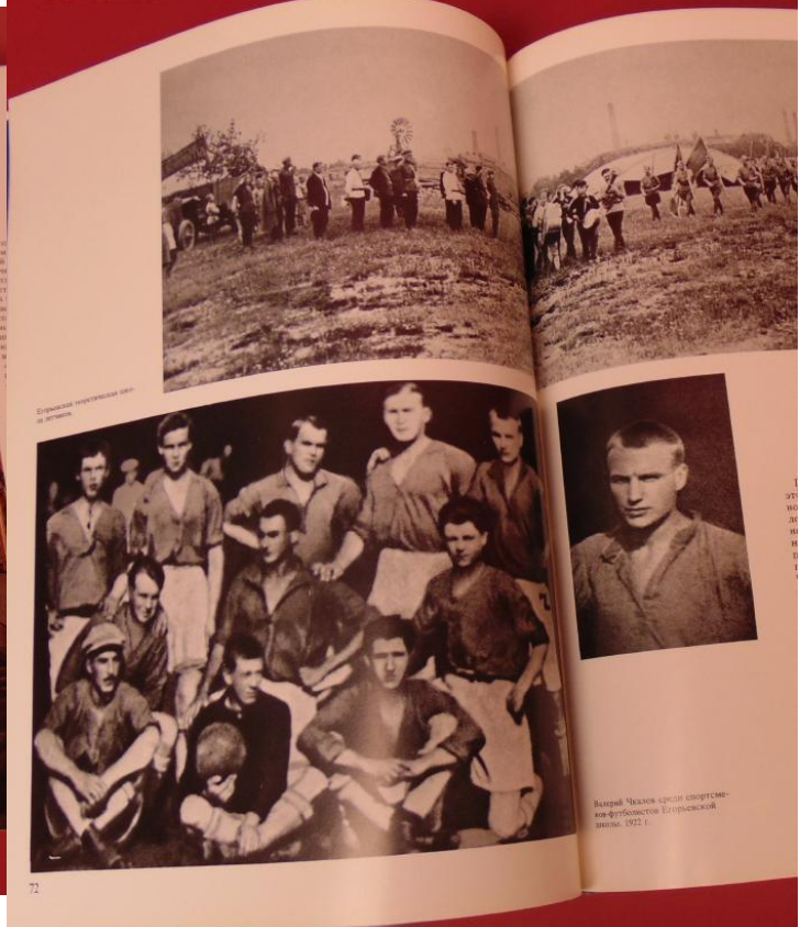
Валерий Чкалов среди спортсме- нов-фигуристов из Горьковской школы, 1922 г.