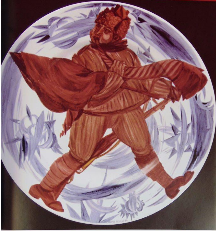
Слева сверху: тарелка с изображением марши Советов народных комиссаров по публицистической композиции И. Пана, 1920-е. Фарфор, роспись. Диаметр 28,2 см. State Porcelain Factory, Petrograd. Right: plate with image of Council of People's Commissars after Cubist composition by I. Pan, 1920s, faience, painting, diameter 28,2