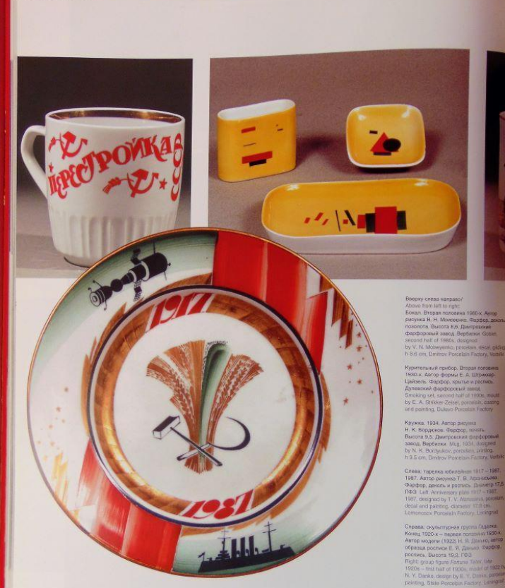
Витраж СССР, 1924. Автор росписи и роспись С. В. Чезина. Фарфор, роспись, позолота, серебрение, эмальевое. Диаметр 33,6. Волжская фарфорово-фаянсовая фабрика Коменданта Давыдова, 1924, designed and painted by S. V. Chizina, porcelain, painting, gilding, silver staining, engraving, diameter 33,6 cm, Komendant Porcelain and Faience Factory, Volzhsky