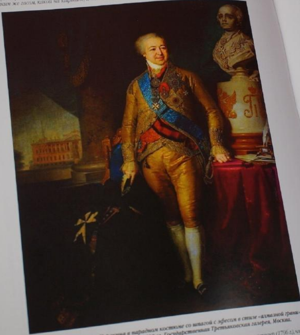
Портрет князя А. Б. Куракина в парадном костюме со шляпой в стиле «алямпин» (Москва, 1856 г.). Автор К. Боровиковский. 1801-1802 гг. Государственная Третьяковская галерея, Москва.