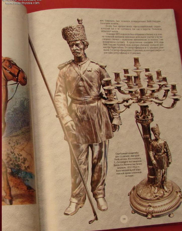
Серебряный канделябр для 13 свечей с фигурой Лейб-казака. Изготовлен в С.-Петербурге постановлением Двора Его Величества в 1912-1913 гг. Бельгийский музей еврейской армии и вооружения.