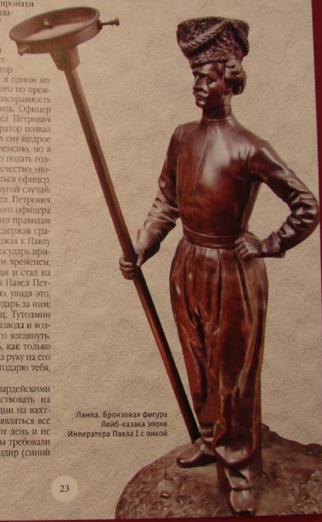
Лампа. Бронзовая фигура Лейб-казака эпохи Императора Павла I с пикой