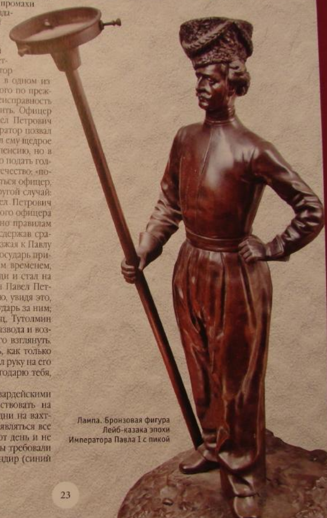
Лампа. Бронзовая фигура Лейб-казака эпохи Императора Павла I с пикой