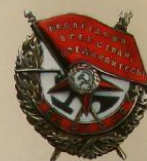
Образец 1934—1943 гг.