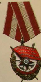
Образец 1943—1991 гг.