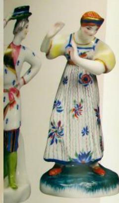
«Павучи и павучи»

Выполнены по образцам 1880-х годов. Роспись фигурки по рисунку Е.П. Мухоморова. ГДЗ - 1923 год.