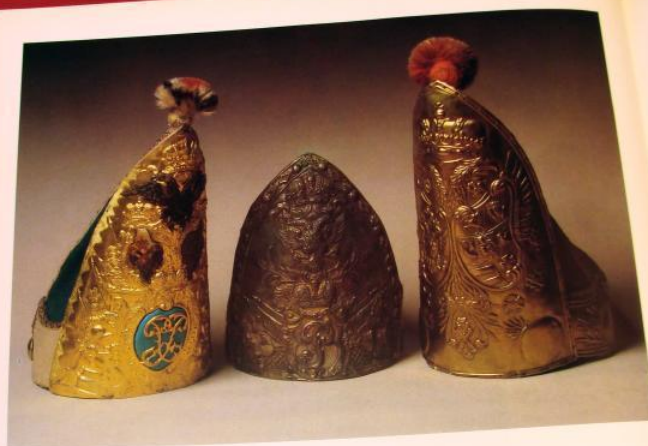
Большим влиянием к прусским формам обмундирования и прическам