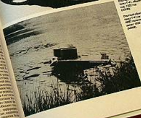
Демонстрация танка OT-131 на выставке 1952 года