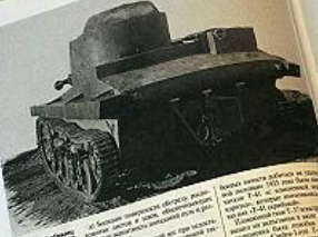
ОТ-38 амфибный танк 1942-44 гг.