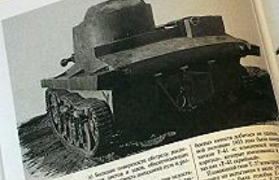
Демонстрация танка OT-131 на выставке 1952 года

В начале войны в СССР не было ни одного танка, способного преодолевать водные преграды. Поэтому в 1941-1942 гг. были разработаны и построены первые советские плавающие танки OT-131 и OT-132. Эти машины были созданы на базе танка Т-34. Они имели водоизмещение 15-16 тонн, скорость движения по воде 10-12 км/ч, дальность плавания 100-120 км. Вооружены они были 45-мм пушкой и 7,62-мм пулеметом. В 1943 г. были разработаны и построены плавающие танки OT-131 и OT-132. Эти машины были созданы на базе танка Т-34. Они имели водоизмещение 15-16 тонн, скорость движения по воде 10-12 км/ч, дальность плавания 100-120 км. Вооружены они были 45-мм пушкой и 7,62-мм пулеметом.