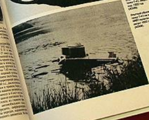
ОТ-38 амфибный танк 1942-44 гг.