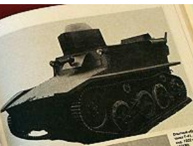
Демонстрация танка OT-131 на выставке 1952 года

В начале войны в СССР не было ни одного танка, способного преодолевать водные преграды. Поэтому в 1941-1942 гг. были разработаны и построены первые советские плавающие танки OT-131 и OT-132. Эти машины были созданы на базе танка Т-34. Они имели водоизмещение 15-16 тонн, скорость движения по воде 10-12 км/ч, дальность плавания 100-120 км. Вооружены они были 45-мм пушкой и 7,62-мм пулеметом. В 1943 г. были разработаны и построены плавающие танки OT-131 и OT-132. Эти машины были созданы на базе танка Т-34. Они имели водоизмещение 15-16 тонн, скорость движения по воде 10-12 км/ч, дальность плавания 100-120 км. Вооружены они были 45-мм пушкой и 7,62-мм пулеметом.