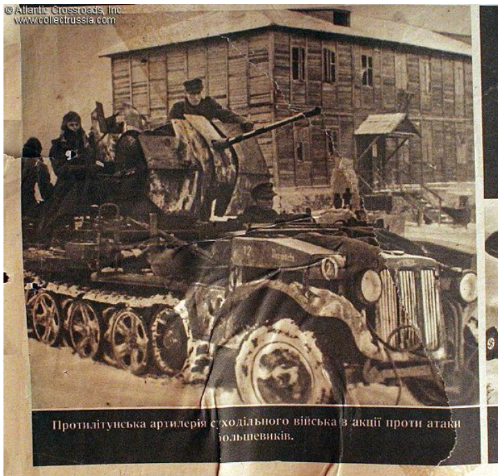
Протипітунська артилерія є ходільного війська з акції проти атаки большевиків.