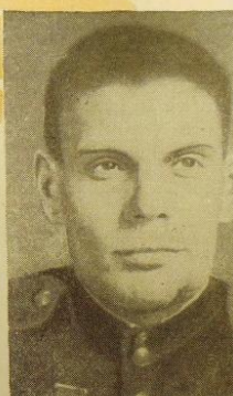
Гвардии капитан В. Г. МАССАЛЬСКИЙ Герой Советского Союза

Четыре суток вел бой с превосхо- дящими силами противника и за это время подбил из своего орудия два немецких танка "Тигр", сжег само- ходное орудие "Фердинанд", уничто- жил 6 вражеских минометов, на- сколько пулеметных точек врага и истребил свыше 150 немецких солдат и офицеров.