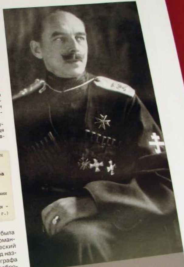
П.М. Авалов-Бермондт. Фото из книги воспоминаний П. Авалова-Бермондта "В борьбе с большевиками", Глоксштадт Гамбург, 1925 г.