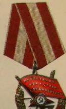
Обрете 1943—1991 гг.