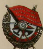
Обрете 1924—1943 гг.