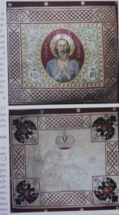
Знамя №1. Знамя в штандартном варианте.

Еще недавно помнил о русских знаменах только коллекционер или человек, увлекающийся историей, а теперь они появились и на аукционах, и в интернет- магазинах. С 1990-х годов становилось все больше людей, интересующихся историей, а также коллекционированием знамен. Если же не просто коллекционировать, а еще и использовать знамена в качестве декоративных элементов интерьера, то это уже искусство. В наше время, когда знамена — это не только исторический документ, но и элемент декора, их атрибуция становится важной задачей.