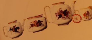
212 Надпись: «Воскресение» (С. 11), 1924.