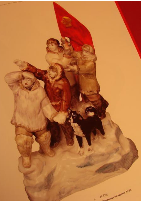
49 (16) «Воскресение» (С. 11), 1927.