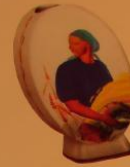
171 Воскресение, 1924.