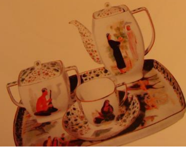
315 Соборный храм СССР, 1924.