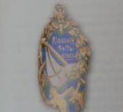
253. Жетон Киевского яхт-клуба

Сохранились и представлены жетоны Киевского и Дифавидско- го яхт-клубов.