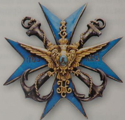
105. Знак 114-го Новоторжского пехотного полка

В дальнейшем, после различных присвоено наименование «114-й пехотный полк».