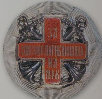
208. Знак «За спасение погибающих на море» (2-й ст., предположительно подносной)