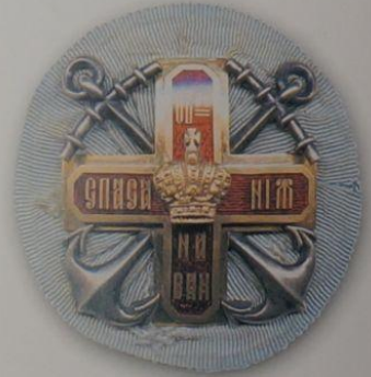
209. Знак «Общество спасения на водах» (1-й ст., предположительно подносной)

Встречают знаки, как пр примерно в п и более сложн исполнения. О чительно режа по ним ничег Предположите носные. Оди следующим о ребриный гре лучами кото скрещенных о крест наложен чуть меньшего ными углами, красного цвет дит надпись, т скими буквами ПОГИБАЮЩ носился на ро ленты.