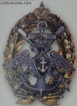
73. Знак за окончание морского отдела Курсов гардемарин флота

Существует жетон в память плавания воспитанников Морского корпуса на крейсере «Князь Пожарский». К сожалению не удалось установить год плавания. На крейсере «Князь Пожарский» в качестве учебного судна плавал с 1906 по 1911 г. Однако, жетон промок и не сохранился.