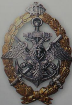
75. Знак за окончание Курсов гардемарин флота по морской части (Временное правительство)

ой эмалью. Это относится к знаку «Курсы гардемарин флота по морской части». Знак за окончание Курсов гардемарин флота по механической части точно такой же, но щиток с топорами вместо якоря и покрыт красной эмалью.