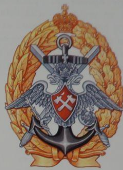
74. Рисунок знака за окончание механического отдела Курсов гардемарин флота