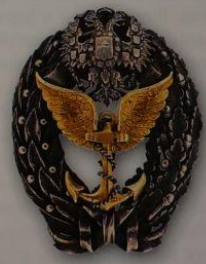
66. Знак за окончание офицерского Воздухоплавательного класса (вар. 2)

приятелем, в четырех морских сражениях взятии десяти крепостей.