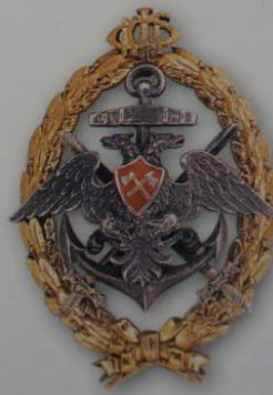
76. Знак за окончание Курсов гардемарин флота по механической части (Временное правительство)

Жетон выполнен в виде щита. По диагонали на нем расположены флагами полевые корабли. В левом верхнем углу написан в 3 строки: КАМПАНИЯ НА КРЕЙСЕР Князь Пожарский . В правом нижнем углу расположена монограмма владельца жетона. Надпись выполнена черной эмалью.