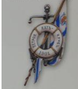
249. Жетон Петровского яхт-клуба