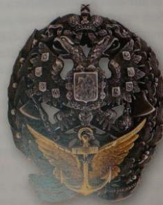
65. Знак за окончание офицерского Воздухоплавательного класса (вар. 1)

Приказом по Военному ведомству за № 48 от 6 марта 1896 г. для окончивших курс офицерского класса учебного Воздухоплавательного парка был утвержден особый нагрудный знак. Основу знака составляет