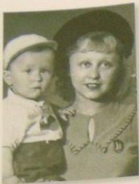
Илл. 97. Киноактриса Я.Б. Жельо