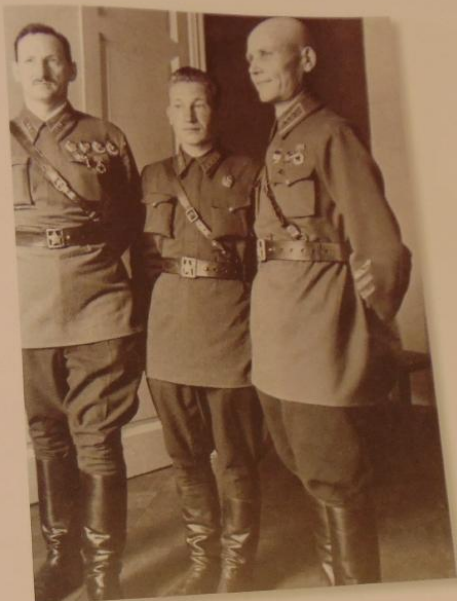
Пл. 80. Военнослужащие, удостоенные наград (слева направо): М.Г. Ефремов, П.Д. Абысов а , И.С. Конев. 27 июля 1958 г.