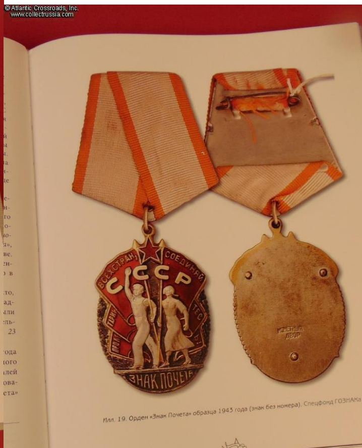
Илл. 19. Орден «Знак Почета» образца 1943 года (знак без номера). Спецфонд ГОЗНАКА