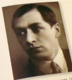
Илл. 99. Балетмейстер И.А. Моисеев. 1935 г. Фотограф Б.Д. Фабисович. ГЦМ им. А.А. Бахрушина. КП 252504/2341