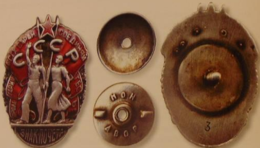
Илл. 15. Орден «Знак Почета» образца 1935 года (знак № 3; здесь и далее, если не оговорено особо, знаки орденов показаны с увеличением в 2 раза)