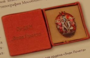
Илл. 10. Коробочка для ордена «Знак Почета»

К этому же сроку необходимо было сделать и коробки для самих знаков. Заказ на изготовление 250 коробочек разместился на картонажной фабрике Мособисполкома. А дерматинные этикетки для коробочек в количестве 260 штук с надписью в две строки – ОРДЕН / «Знак Почета», – тисненые золотом, должна была напечатать 8-я типография Мособисполкома.