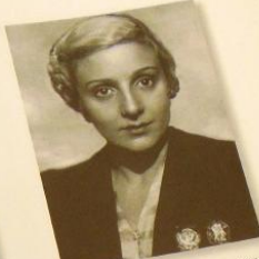
Илл. 100. Балерина М.М. Дудинская. 1941 г. КП 325812/54