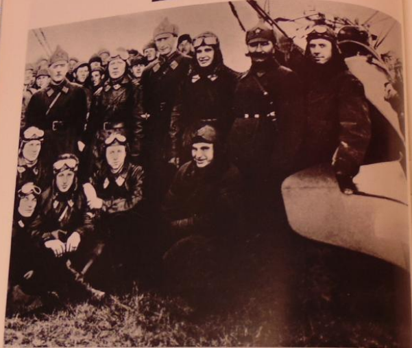
В. П. Чкалов на встрече участников воздушного парада с К. Е. Ворошиловым и С. М. Буденным, 1927 г.

... Весь аэродром кричал и аплодировал моей фигуре. Мне было разрешено делать любую фигуру и на любой высоте. То, за что я сидел на гауптвахте, здесь отмечено особым приказом, в котором говорится: «Выдать денежную награду старшему летчику Чкалову»