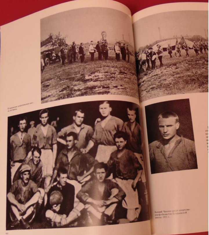
Валерий Чкалов среди спортсме- нов-футболистов 1922 г.