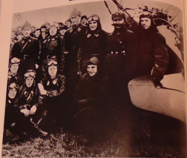
В. П. Чкалов на встрече участников воздушного парада с К. Е. Ворошиловым и С. М. Буденным, 1927 г.

... Весь аэродром кричал и аплодировал моей фигуре. Мне было разрешено делать любую фигуру и на любой высоте. То, за что я сидел на гауптвахте, здесь отмечено особым приказом, в котором говорится: «Выдать денежную награду старшему летчику Чкалову