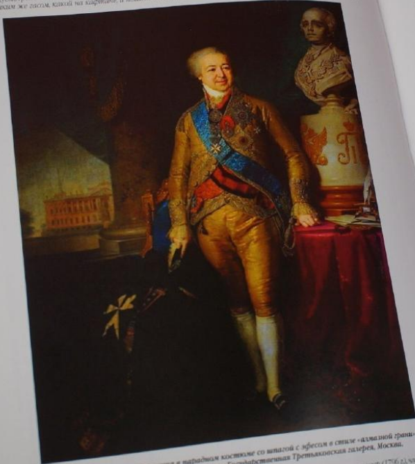
Портрет князя А. Б. Куракина в парадном костюме со шляпой с эфесом в стиле «дамской грани». Автор К. Боровиковский. 1801-1802 гг. Государственный Третьяковский музей, Москва.

Портрет князя А. В. Курякина в парадном костюме Грессинского Третьяковского Автор К. Бороваковский. 1801-1802 гг. Государственный Эрмитаж.