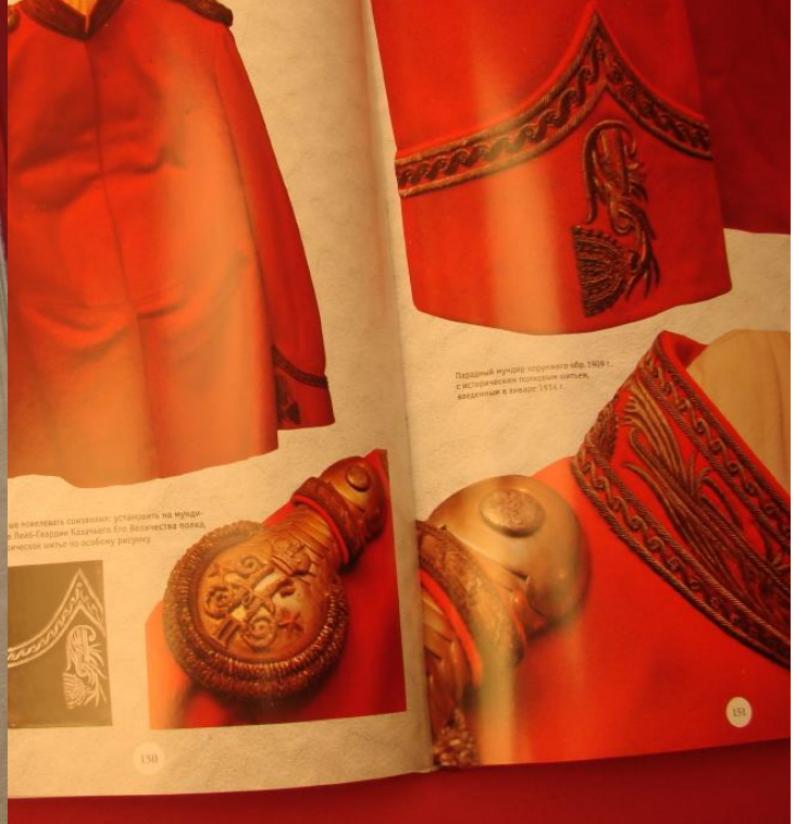
Парадный мундир полковника 1890 г. с историческим полковым орденом, выданным в 1819 г.