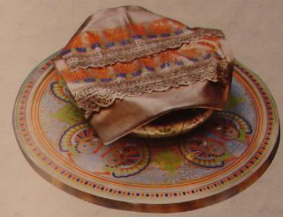
Серебряная чаша, выполненная в технике перепрозрачной эмали, с крышечкой стилизованной под солониху. Изготовлена в честь Столетия Лейб-Гвардии Казанского полка в 1875 г. Выполнена в Санкт-Петербурге по заказу Двора Е. В. Павлом Пачининым. 1875 г.