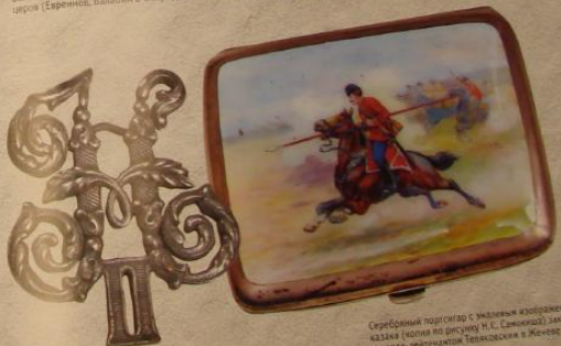
Серебряный портрет с эмалью изображением Лейб-Гвардии Казанского полка по рисунку М. С. Савицкого, замком полковника-лейтенанта Тельянского в Женеве.