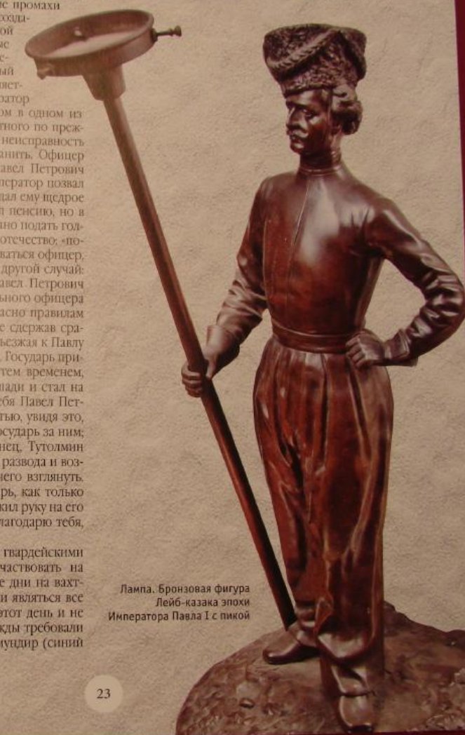
Лампа. Бронзовая фигура Лейб-казака эпохи Императора Павла I с пикой