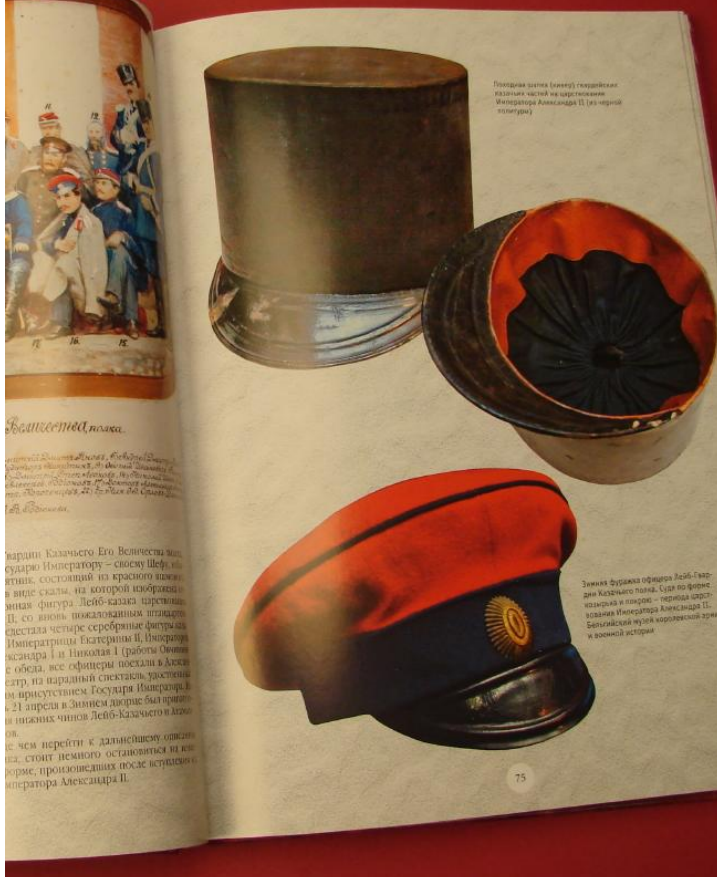
Полудневная шляпа (шлем) генерал-лейтенанта Казанского полка на царствование Императора Александра II (из черной эмалированной).