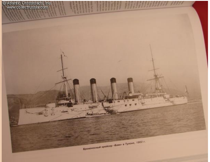
Бронированный крейсер «Баян» в Тулоне, 1902 г.