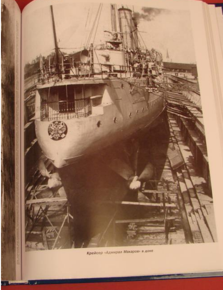
Крейсер «Адмирал Макаров» в доке