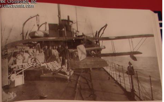
Аварийный гидросамолет, поднят на борт эсминца «Новик», 25 сентября 1915 г.

Проектирование корабля началось в 1908 году. В 1910 году он был заложен на верфи в Петербурге. Корабль строился в рекордные сроки — всего за 18 месяцев. В 1911 году он был спущен на воду и в том же году принят в состав Балтийского флота. Корабль был вооружен двумя 152-мм артиллерийскими орудиями и шестью 75-мм орудиями. Его максимальная скорость составляла 24 узла. Корабль был построен по проекту, разработанному в 1908 году. В 1910 году он был заложен на верфи в Петербурге. Корабль строился в рекордные сроки — всего за 18 месяцев. В 1911 году он был спущен на воду и в том же году принят в состав Балтийского флота. Корабль был вооружен двумя 152-мм артиллерийскими орудиями и шестью 75-мм орудиями. Его максимальная скорость составляла 24 узла.