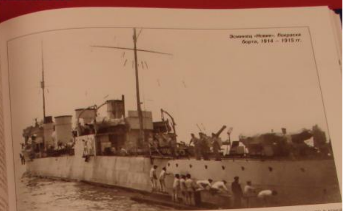
Эсминца «Новик». Поисковая база, 1914 — 1915 гг.