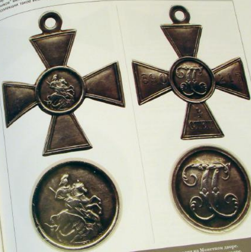
Слева - Знак отличия Военного ордена, награждение 1815 г., изготовлен на Монетном дворе. Справа - Георгиевский крест времен Первой мировой войны, изготовлен на Монетном дворе.

- Государственный Исторический музей, Москва (262 креста), - Музей русской истории при Свято-Троицкой духовной семинарии в Дорославеле, США (15 крестов), - "Награды императорской России. 1702-1917" интернет-сайт С.М. Куриковского (46 крестов), - Алапова А.И., Москва (44 креста).