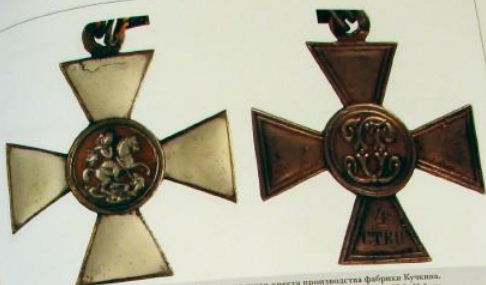
Орден Св. Георгия 4-й ст., перелазивший из Георгиевского креста производства Фабрики Кухмын. Серебро, белая и красная эмали. Весовые «ДК» и аббревиатура после 1908 г. Размеры – 15,6х5,5 см, высота медальона – 15 мм, ширина кожаной ленты – 15 мм. Предположительно, изготовлен в ювелирной фирме «Универсальная» г. Петербурга. Москва. Абсолютно идентичный был продан на аукционе «Лоттеи и Лейб» в мае 2007 г., цена около, выставленный в офисе Росбанка (квиток о покупке № 24 / 90)