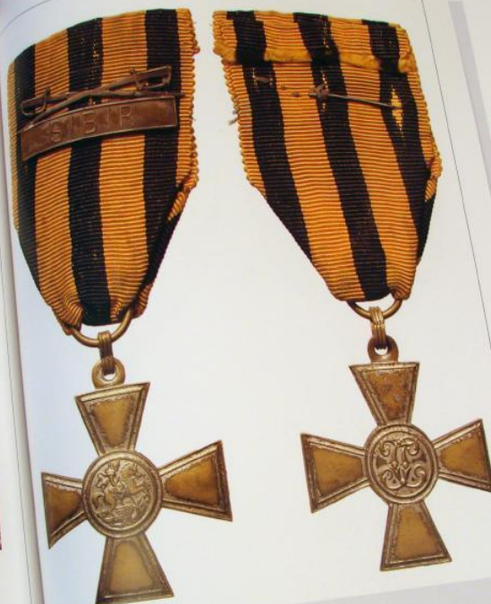
Бумажный крест с накладкой на ленте с надписью "Сибирь" "Архивы и войны" № 44, 2 июня 2007 г.