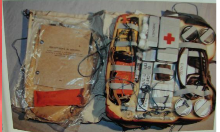
CHAPTER 1: Survival Equipment and Related Components • 7

...enter right by way of rubberized material and a heavy elastic band. In this manner, contents are protected and an emergency can be used as a float carrier or, filled with air, as a flotation device. RIGHT: A diagram of the main compartment components is printed on rubberized cloth flap.