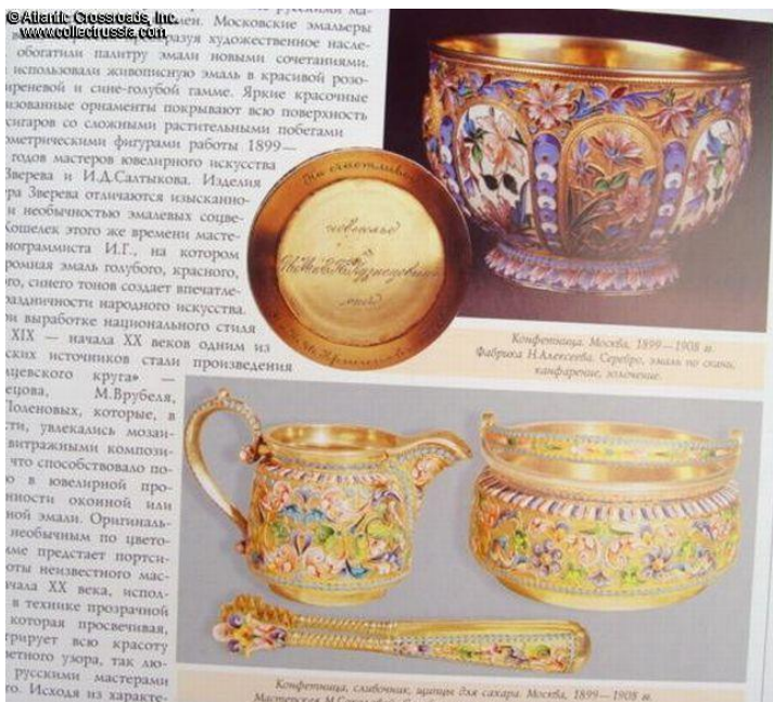
Конфетница. Москва. 1899—1908 гг. Фабрика Н.А. Алексеева. Серифы, эмблемы по образцу конфетниц, различение.