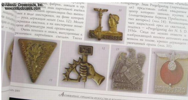
Антиквариат, предметы искусства и ювелирные изделия