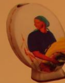
171 Воскресение, 1924.