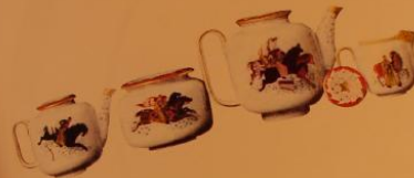
212 Надпись: «Воскресение» (С. 11), 1924.