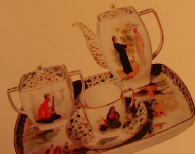
315 Соборный храм СССР, 1924.