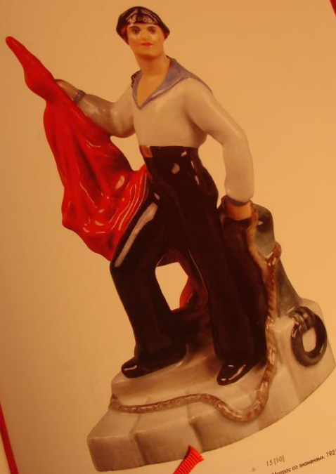
15110 «Морской» (С. 11), 1921.