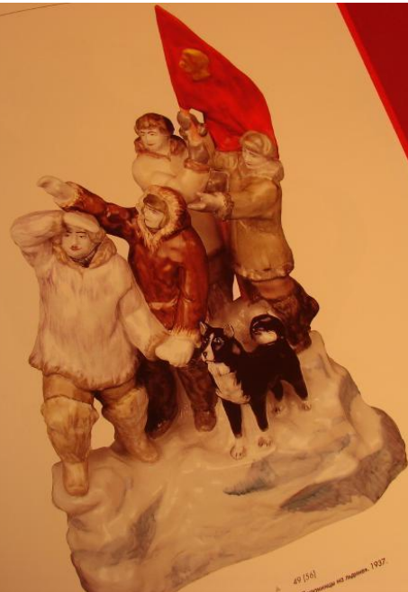
49 (16) «Воскресение» (С. 11), 1927.