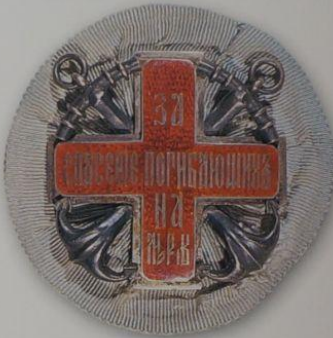
208. Знак «За спасение погибающих на море» (2-й ст., предположительно подносной)