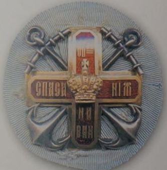
209. Знак «Общество спасания на водах» (1-й ст., предположительно подносной)

Встречают знаки, как пр примерно в п и более сложн исполнения. О чительно режа по ним ничег Предположите носные. Оди следующим о ребриный гре лучами кото скрещенных о крест наложен чуть меньшего ными углами, красного цвет дит надпись, т скими буквами ПОГИБАЮЩ носился на ро ленты.