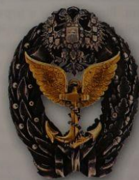
66. Знак за окончание офицерского Воздухоплавательного класса (вар. 2)

приятелем, в четырех морских сражениях взятии десяти крепостей.