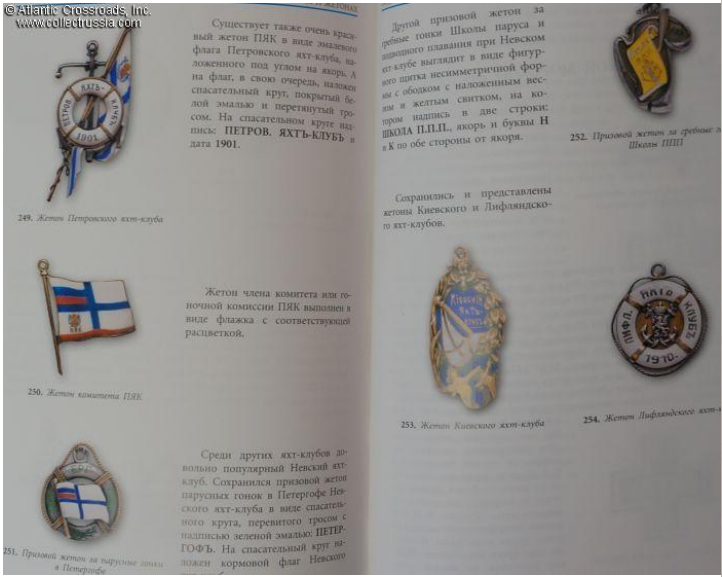
249. Жетон Петровского яхт-клуба