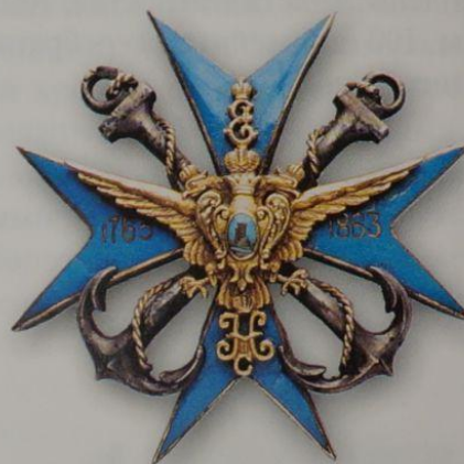
105. Знак 114-го Новоторжского пехотного полка

В дальнейшем, после различных присвоено наименование «114-й пехотный полк».