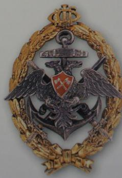
76. Знак за окончание Курсов гардемарин флота по механической части (Временное правительство)

Жетон выполнен в виде щита. По диагонали на нем расположены флагами помеченные корабли. В левом верхнем углу надпись в 3 строки: Кампания на крейсере Князь Пожарский. В правом нижнем углу расположена монограмма владельца жетона. Надпись выполнена черной эмалью.