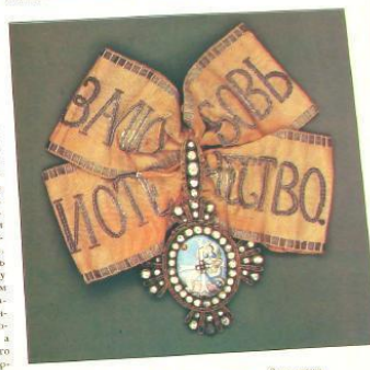
Знак «одно- го Единицы» 2-й степени указывает на единичность ЛНМ

быви и отечество». Знаки Божьего креста должны быть крупнее и богаче украшены, а крест — «пославий орнамент» — отнесен ко всем как неуместному, так и в украшении богослужения». О знаке в уставе ничего не сказано, но уже в петровские времена появились и оны. Сначала произвольной формы, затем посланционные. Иконописцами из серебра и в XVIII в. обильно украшали бриллиантами и алмазами, а в центре помещали красный эмальевый медальон с изображением полукозла, креста и ор